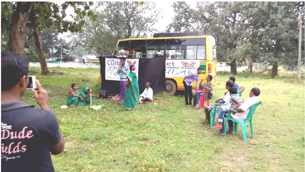
चित्र 2. सीजीनेट स्वर यात्रा दल की प्रस्तुति देखते हुए ग्रामवासी. (ग्राम गातापाल, जिला दंतेवाडा, छत्तीसगढ़)